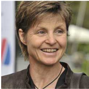
Erika Hess - Suisse