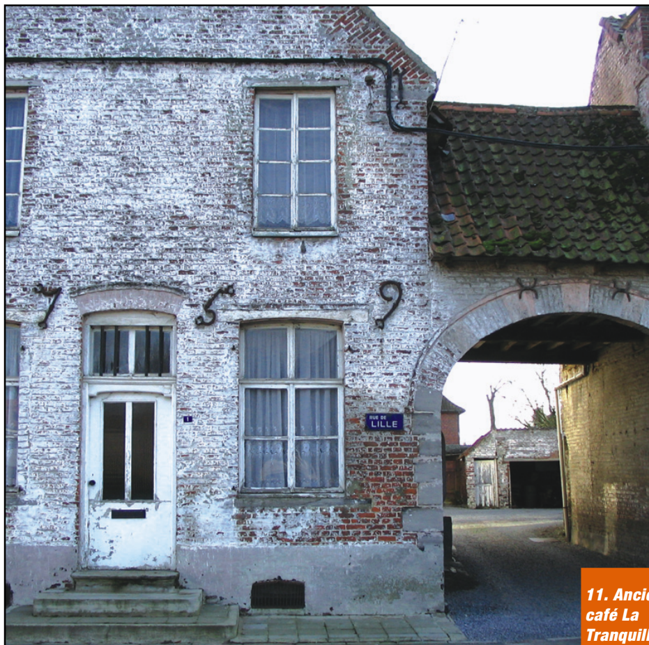
11. Ancien café La Tranquillité