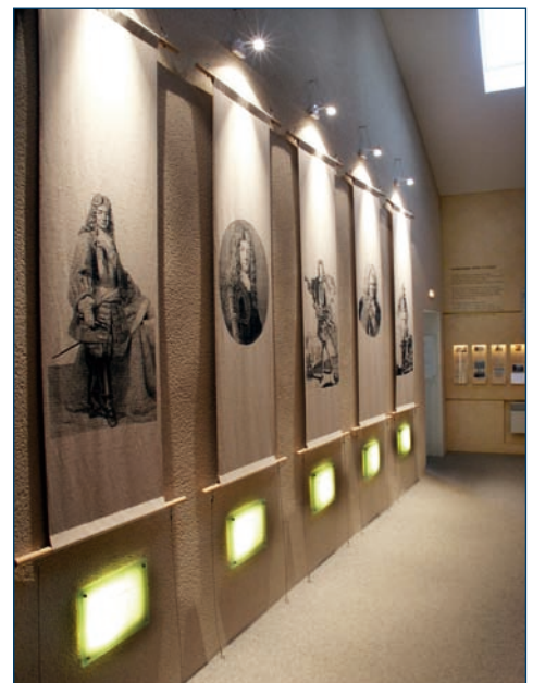
▼ Maison Vauban

L'autre association majeure se dénomme les Amis de la Maison Vauban. Elle a été créée en 1980 par