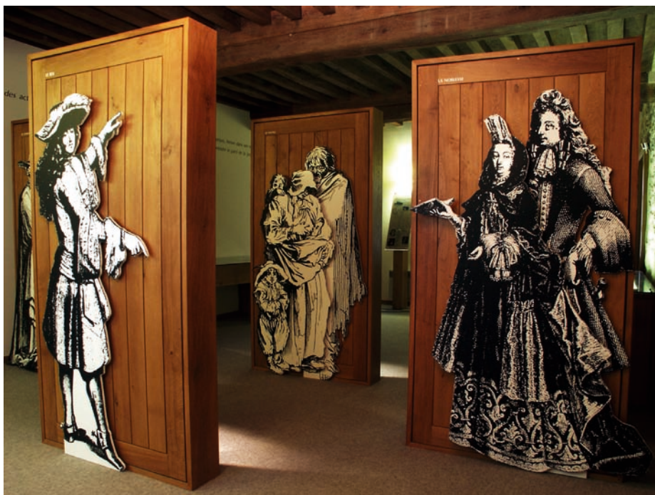
▲ Maison Vauban

des habitants de Saint-Léger-Vauban passionnés par la vie et l'œuvre de Vauban. Elle édite depuis 1983 des ouvrages sur Vauban. »