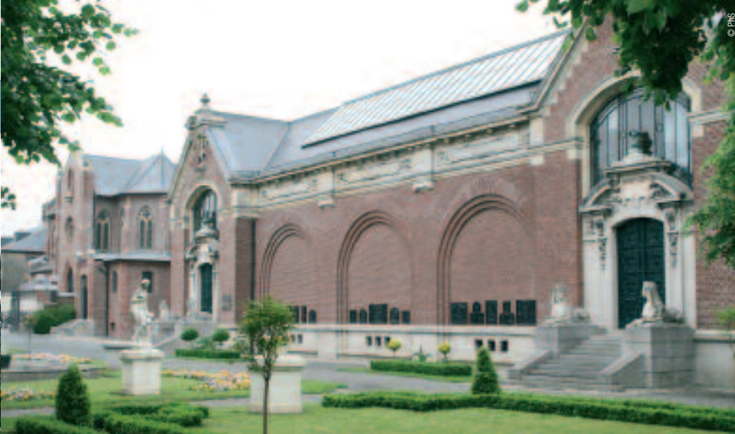
LE MUSÉE LOMBART À DOULLENS ROUVERT APRÈS 99 ANS DE SOMMEIL