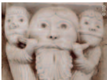
Un péché capital à l'église Saint-Léger à Lucheux