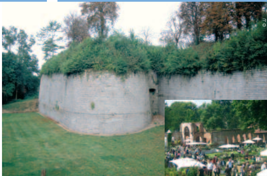
Plus de 5 500 visiteurs se rendent à la fête des plantes, début juin, à la citadelle de Doullens

Direction la cité médiévale de Luceux. Sur la route, bifurquez par Grouches-Luchuel. Détendez-vous au bord des marais et des larris, pelouses calcaires. Observez la beauté bucolique de l'ancien moulin à eau, qui abrite des chambres d'hô-