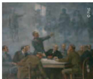
Tableau du Maréchal Foch à la mairie de Doullens

Citadelle, beffrois, château fort : pour se protéger des invasions, le Douillennais a bâti en dur, mais aussi en beau. Poussez donc les portes des trésors de Doullens et de Lucheux. Surprises garanties.