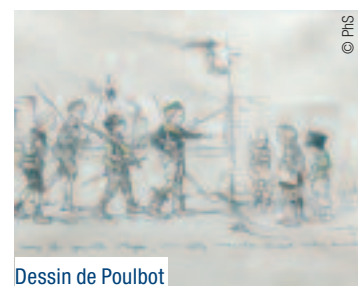
Dessin de Poulbot

Vos pas vous guident jusqu'à l'hôtel de ville en brique et pierre, bâtiment de la fin du XIX ème siècle. Empruntez le vaste escalier menant jusqu'à la salle du commandement unique**. Le décor rappelle qu'il y a un peu plus de 90 ans, le 26 mars 1918, les alliés y ont confié le commandement unique de leurs troupes, alors malmenées, au général Ferdinand