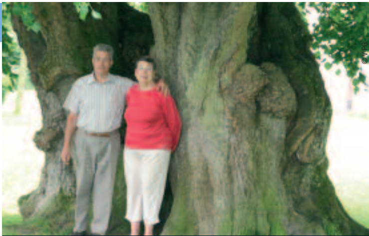
L'ARBRE DES ÉPOUSAILLES, UNE COUTUME MÉDIÉVALE

Quelques mètres plus haut, les imposants restes du donjon (XII ème et XIII ème siècles) permettent de mieux comprendre la vie quotidienne au Moyen Age. La pièce seigneuriale du premier étage, habitée lors de sièges, était éclairée par des torches. Du haut du donjon, on pouvait voir jusqu'à une dizaine de kilomètres à la ronde. Quant aux remparts, en lisière de forêt, ils sont dotés de mâchicoulis sur arcades.