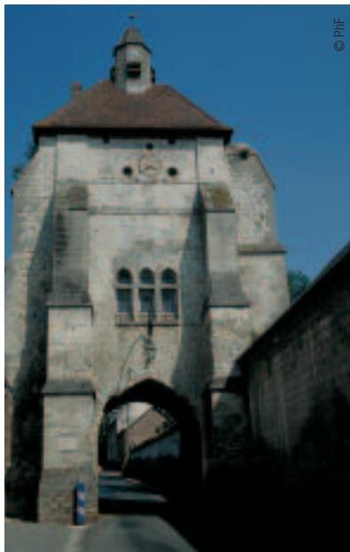
LE BEFFROI DE LUCHEUX

A côté, la chapelle ruinée. "Elle était bâtie au bord du fossé, précise Vincent Vasseur car on n'attaquait pas un édifice religieux. Le reste du château était protégé par ailleurs".