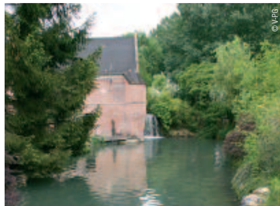
LE MOULIN DE GROUCHES-LUCHEUX

tes. "Luceux est l'un des rares villages de la Somme qui possède encore les trois édifices de la société française moyenâgeuse : l'église du clergé, le château-fort de la noblesse et le beffroi du tiers Etat," précise Vincent Vasseur. Sur la charmante place du village subsistent de belles demeures du XVIII ème siècle, dont l'actuelle mairie. Honneur au beffroi** installé à deux pas sur l'ancienne porte de la ville fin XIII ème , et lui aussi classé au patrimoine mondial de l'UNESCO. Au premier étage, une salle rappelle que le 19 juin 1464, Louis XI a institué la poste royale aux chevaux, l'ancêtre de notre Poste actuelle. Au pied, une plaque témoigne du passage de Jeanne d'Arc en 1430. La Pucelle aurait été enfermée dans la prison des bourgeois du château fort. Le seigneur de Luceux était en effet Jean de Luxembourg, qui l'avait vendue aux Anglais. Le château fort** des XII ème XIII ème et XIV ème siècles, qui domine le village, occupait une place stratégique. Malheureusement, la forteresse a été démantelée sur ordre de Richelieu. Marchez sur le sol pavé pour pénétrer dans ce lieu qui appartient à la