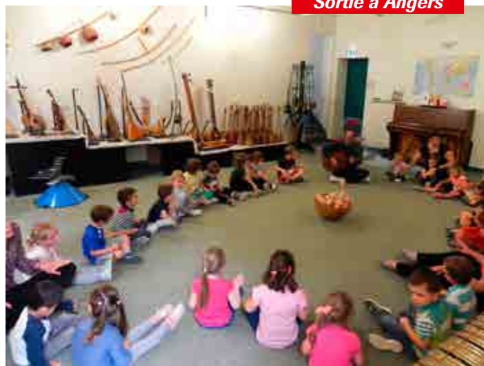
Sortie à Angers

Tout renseignement concernant les inscriptions à l'école, la cantine, le car ou les APS est à prendre auprès du secrétariat du SIFUP installé dans la direction de l'école les lundi, mardi, vendredi de 8h à 12h et le mercredi de 9h à 12h.