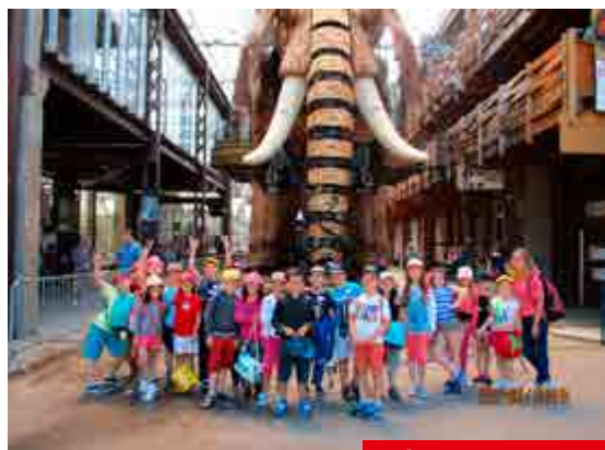
Sortie à Nantes

Au cours de l'année 2017-2018 plusieurs projets ont été menés, voici quelques photos les concernant.